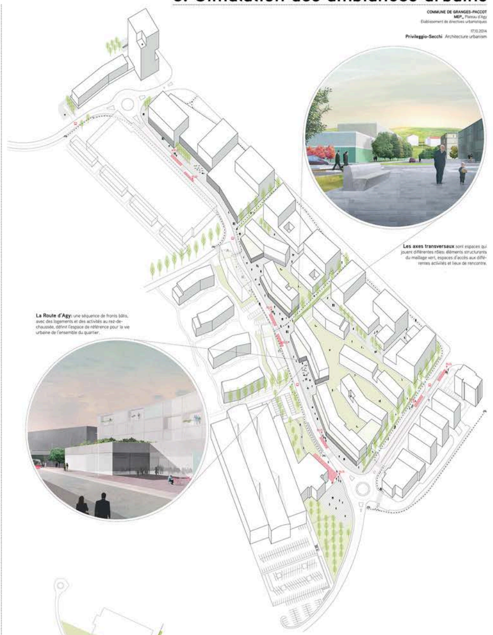
La Route d'Agy: une séquence de fronts bâtis, avec des logements et des activités au rez-de-chaussée, définit l'espace de référence pour la vie urbaine de l'ensemble du quartier.