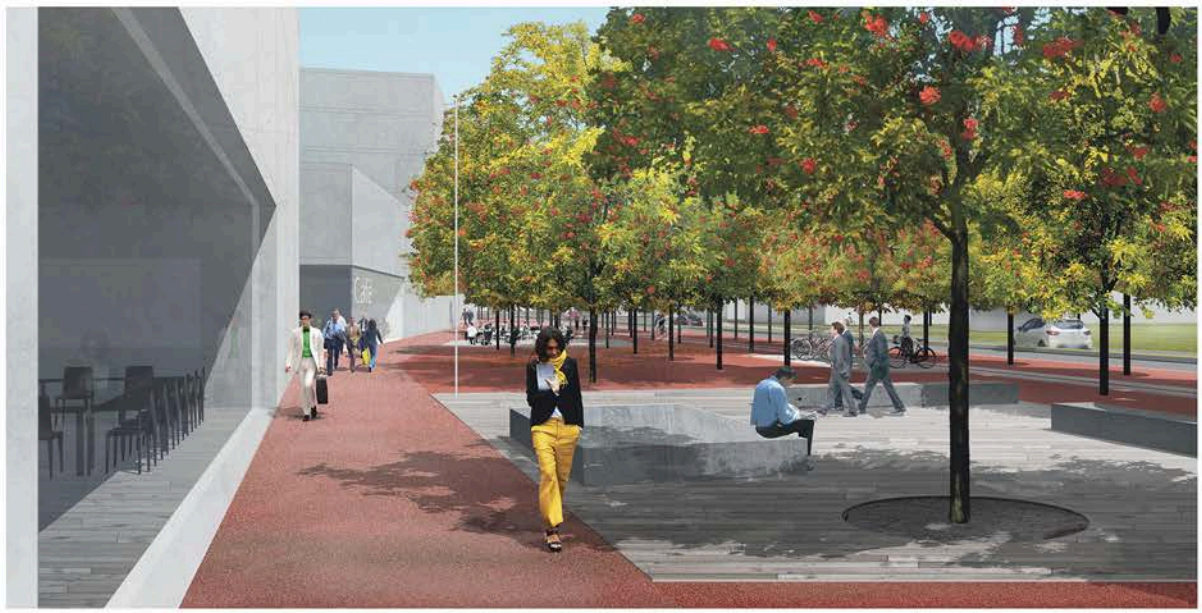
Le seuil de la ville. La Rue de Morat est pensée comme un boulevard contemporain qui est une seuil entre le grand paysage et la ville compacte. Espace de référence à l'échelle de l'Agglo qui identifie l'entrée en ville.