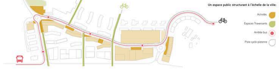
Les axes transversaux sont espaces qui jouent différentes rôles: éléments structurants du maillage vert, espaces d'accès aux différentes activités et lieux de rencontre.